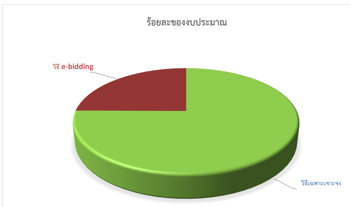
แผนภูมิแสดงร้อยละของจำนวนงบประมาณ จำแนกตามวิธีการจัดซื้อจัดจ้าง ปีงบประมาณ พ.ศ. ๒๕๖๕

จากตาราง จะเห็นได้ว่างบประมาณในภาพรวมที่ใช้ในการจัดซื้อจัดจ้างสำหรับส่วนของสำนักงานเขตพื้นที่การศึกษาประถมศึกษาเชียงใหม่ เขต ๑ จำนวน ๖,๒๘๓,๗๕๓.๔๓ บาท พบว่า งบประมาณที่ใช้ในการจัดซื้อจัดจ้างด้วยวิธีเฉพาะเจาะจง เป็นจำนวนเงิน ๔,๗๒๑,๑๕๓.๔๓ บาท คิดเป็นร้อยละ ๗๕.๑๓ รองลงมา คือ วิธีประกวดราคาทางอิเล็กทรอนิกส์ (e - bidding) เป็นจำนวนเงิน ๑,๕๖๒,๖๐๐.๐๐ บาท คิดเป็นร้อยละ ๒๔.๘๗